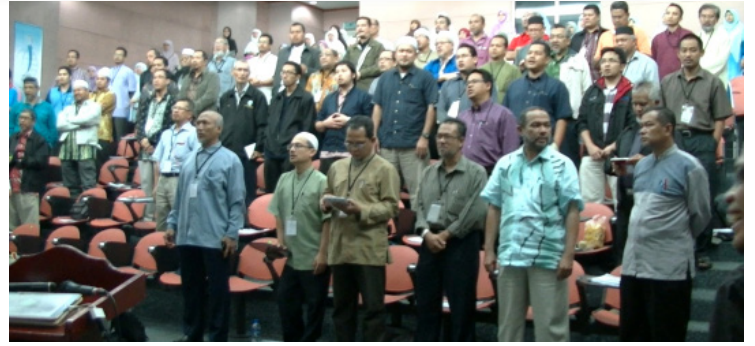
Para hadirin bersama-sama menyanyikan lagu rasmi IKRAM

15 November 2014, Shah Alam. Sekitar 200 peserta telah hadir di dalam program ini bagi mendengar dan memberi maklumbalas kepada Unit manhaj JK Tarbiah