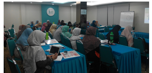
Sebahagian para peserta yang mengikuti program sepanjang dua hari di Dewan Utama, Kompleks IKRAM

23 Januari 2015, Seri Kembangan. Jawatankuasa Pembangunan Mahasiswa (JKPM) pusat telah membuka tirai tahun ini dengan melaksanakan program Tadrib aktivis JKPM(Tajmik) yang dilaksanakan di Dewan Utama Kompleks IKRAM selama dua hari.