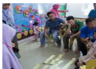
Sebahagian aktiviti yang dilaksanakan sepanjang program