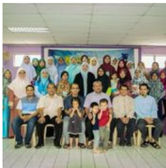
Sesi bergambar para peserta TABRI setelah tamat program

12 Oktober 2014. Shah Alam, Dengan motto "Nahnu Duat Qobla Kulli Syaain" program ini telah berakhir. Setelah menjalani program secara bersiri bermula Oktober 2013 dan berakhir pada 12 Oktober 2014. Program ini adalah platform Tadrif/Pelatihan untuk aktivis belia remaja IKRAM yang dikendalikan oleh JK Belia dan Remaja dengan kerjasama JK