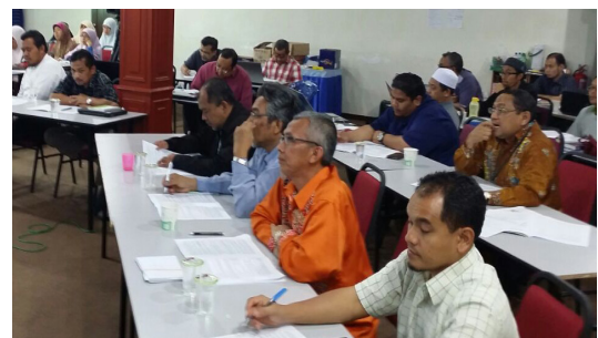
Gambar atas dan bawah: Sebahagian para peserta dari seluruh Negeri Johor yang menyertai daurah anjuran JK Tarbiah Pusat