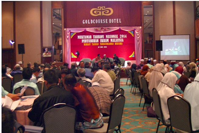
Sebahagian para hadirin "Muktamar Tarbawi Nasional"