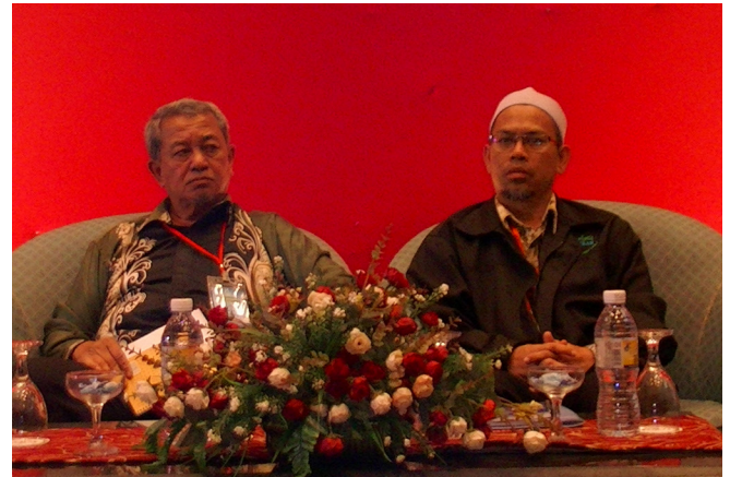
Presiden IKRAM bersama Pengerusi JK Tarbiah Pusat IKRAM

30 Ogos, Klang. Sebahagian para hadirin sepanjang program Muktamar Tarbawi yang berlangsung di Hotel Goldcourse pada, 4 Zulkaedah 1435H/30 Ogos 2014.