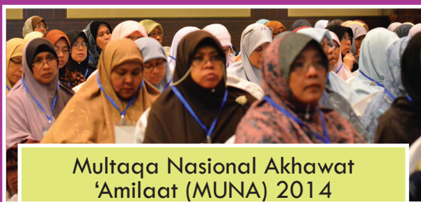
Multaqa Nasional Akhawat 'Amilaat (MUNA) 2014

8 Feb 2014: Sebahagian ahli teras akhwat yang menghadiri Multaqa Nasional Akhawat 'Amilaat (MUNA) 2014 yang berlangsung pada 7-8 Februari di Intekma Resort & Convention Centre, Shah Alam yang dilaksanakan oleh JK Tarbiah Wanita.