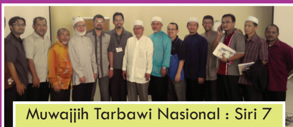
Muwajjih Tarbawi Nasional : Siri 7

8 Feb 2014: Sebahagian ahli teras akhwat yang menghadiri Multaqa Nasional Akhawat 'Amilaat (MUNA) 2014 yang berlangsung pada 7-8 Februari di Intekma Resort & Convention Centre, Shah Alam yang dilaksanakan oleh JK Tarbiah Wanita.