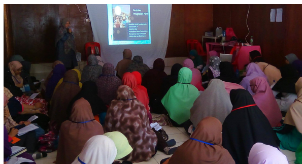
Sebahagian peserta di yang terlibat di dalam program.