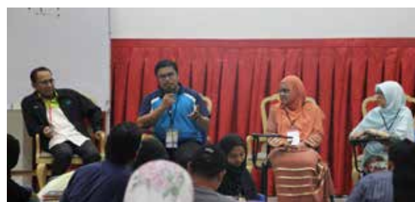
Sebahagian peserta di yang terlibat di dalam program MKI

Selain di berikan latihan-latihan kemahiran dalam kelas (daurah), program MENTORING, dan projek-projek Khas turut diberikan bagi mengembangkan bakat kepimpinan peserta di samping memastikan ciri ciri kepimpinan dalam diri peserta dapat di applikasi dengan baik.